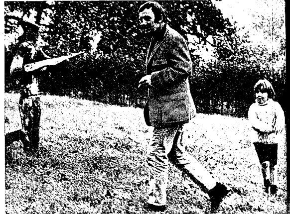
Veel wandelen in de boomgaard, altijd met een sigaret tussen de vingers. Zo heeft Vlaanderens meest omstreden schrijver iets van een hereboer.

ik een uur of wat door het mij omringende landschap wandelen, om helderheid in mijn gedachten te brengen.»