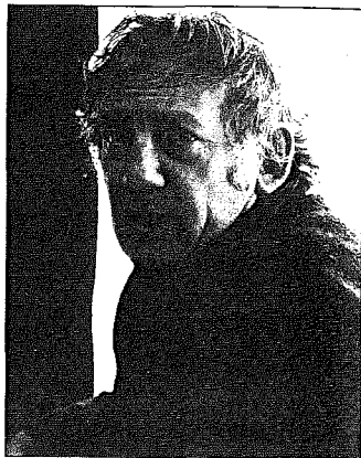
Als je hier toneel wil schrijven ben je bijna verplicht van een zekere graad van medeplichtigheid met het toneelgaande publiek vast te leggen.

H.C.: Ja, maar die verwarren dan twee dingen van verschillende orde, namelijk de weerklank die 'n werk heeft en het werk zelf. Dat zijn twee totaal verschillende dingen. En het enige wat een auteur moet interesseren is dat werk: heeft het weerklank, nou ja, dan is dat meegenomen, maar wanneer hij dat als norm gaat stellen voor de waarde van wat hij doet, dan is hij zeker verloren want dan gaat hij dat proberen te dupliceren en voor hij