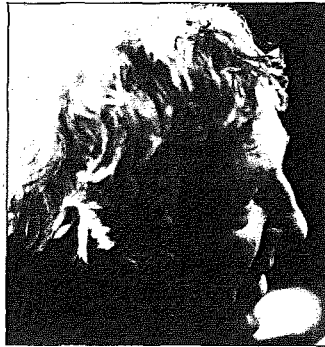
Het zou heel onbeleefd zijn om op je roem te teren en steeds maar hetzelfde te doen. Dan ben je een kruidenier!

W.V.: Je bent in alle geval recordhouder. En naar aanleiding van die vierde bekroning voor toneel werd in een Vlaamse krant de vraag gesteld of er dan geen concurrentie is voor 'Superman' — zo noemde men je — en voor de televisie heb jijzelf op de dag van je huldiging gezegd dat in het land der blinden eenoog koning is en dat je in Vlaanderen graag twintig goeie jonge toneelauteurs zou willen