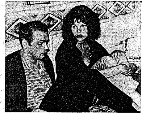
Twee jongeren die een kans krijgen: Bert Dauive (Jackie), links en Hilde Van Mieghem (Christiane)

Claus wil met zijn prent klaar zijn tegen november. «Elf november zou prima zijn. Toen ging, elf jaar geleden, het toneelstuk in werking.»