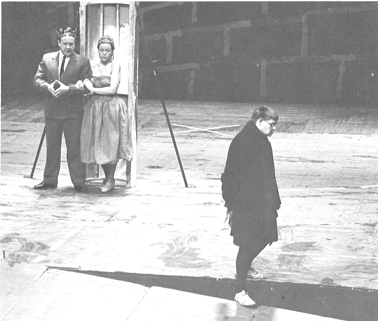
Hamlet (Theater der Freien Hansestadt Bremen)