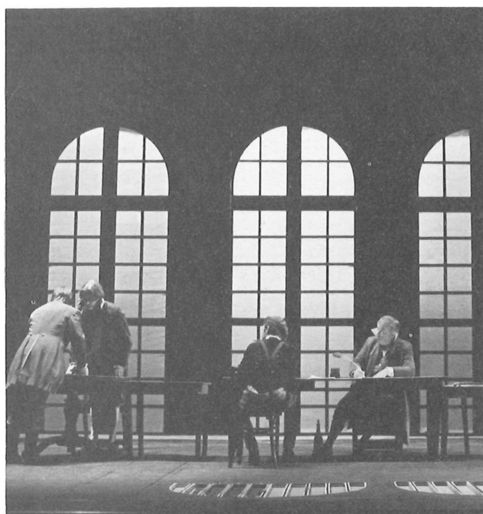
Het Comité van Openbaar Welzijn. Een wat ironische benaming voor een instelling die enkel doodstraffen uitspreekt. De vloer waarop zij zetelt is in andere scènes het verpletterende dak van de gevangenis. Oorzaak en gevolg zijn aanwezig in hetzelfde teken. Tafeltjes, ongelijk van vorm en hoogte, als de wispelturigheid van de revolutionaire rechtspraak.