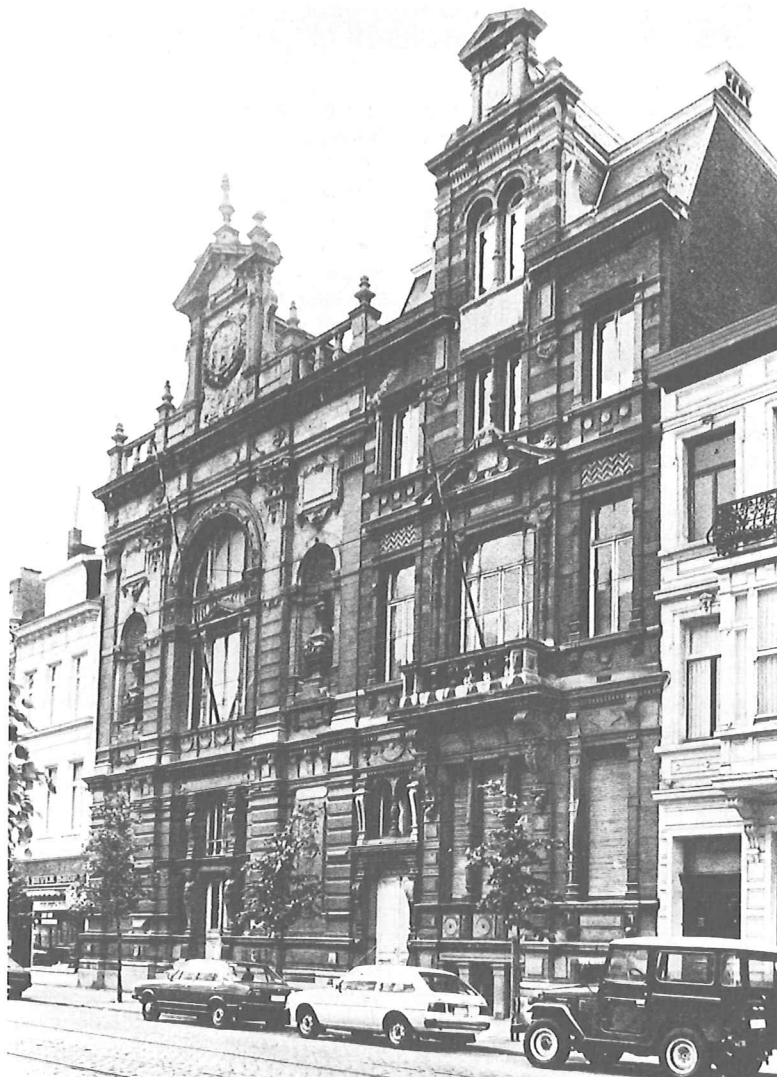
Raamteater op 't Zuid

Vanaf dit seizoen is Antwerpen-Zuid twee "nieuwe" theaterzalen rijker: het Kollektief Internationale Nieuwe Scène begon met voorstellingen in het Zuiderpershuis, en het RaamTeater betrok een voormalig museum. Etcetera-medewerker en architect Pieter T'Jonck nam een kijkje.