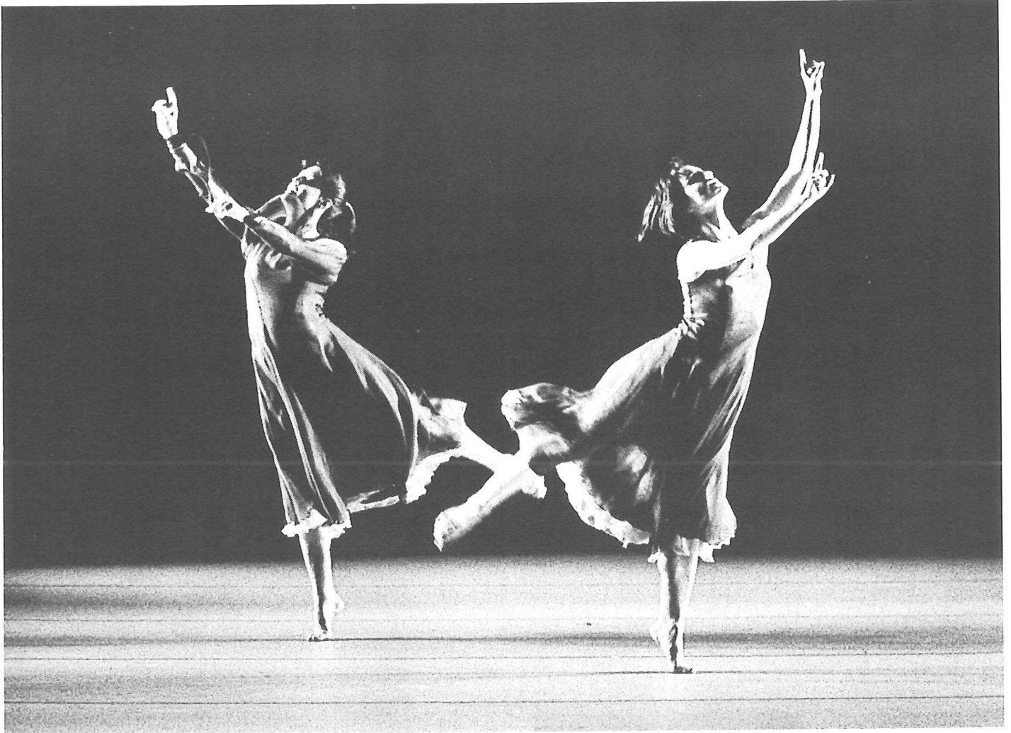
L'Allegro, il Penseroso ed il Moderato. Monnaie Dance Group.