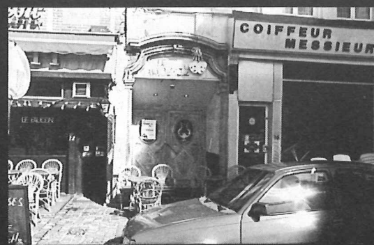
Théâtre de Vaudeville