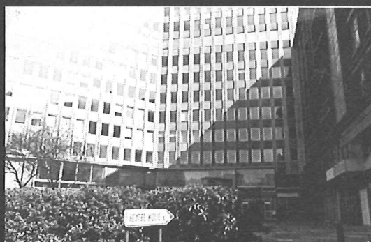
Théâtre Molière K.V.S.