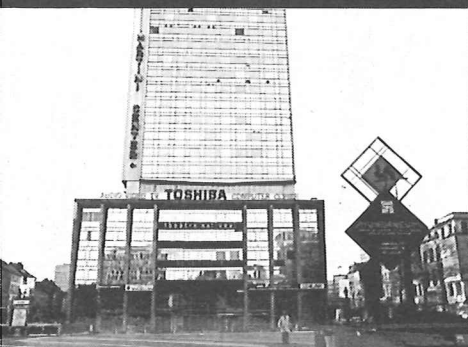
Théâtre National de Belgique Koninklijke Munt-schouwburg

Deze vier gebouwen werden ontworpen vanuit een sterke architectonische en stedenbouwkundige visie: ze