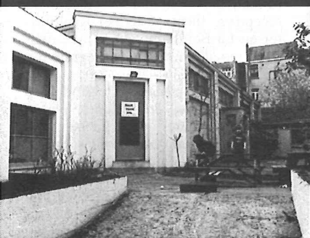
Théâtre Studio Appia

Op gemeentelijk vlak kan ieder bestuur initiatieven nemen die ze denkt te moeten nemen: "On les suit, ou on les suit pas", zei Mevrouw Dassonvil-