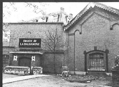
Théâtre de la Balsamine