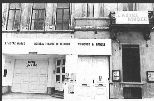
Nouveau Théâtre de Belgique - Viaduc