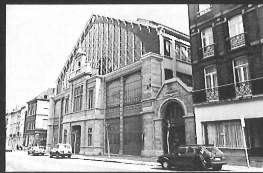
Halles de Schaerbeek