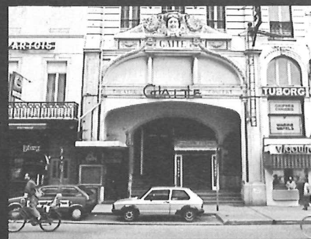
Théâtre de Gaité Paleis voor Schone Kunsten