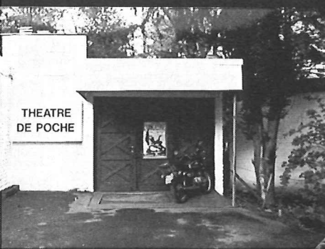
Théâtre de Poche

De gebouwen van de Kruidtuin (1826-29) werden door de Franse Gemeenschap, gelijktijdig met de Ancienne Belgique langs Vlaamse kant, aangekocht om er een Centre Culturel de la Communauté Française Wallonie-Bruxelles van te maken. Het complex omvat nu twee theaterzalen, L'Orangerie en La Rotonde, resp. voor 284 en 150 toeschouwers. L'Orangerie is flexibel ingericht maar