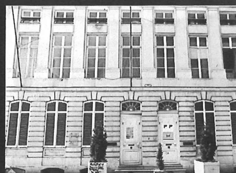
Nouveau Théâtre de Belgique - Martyres