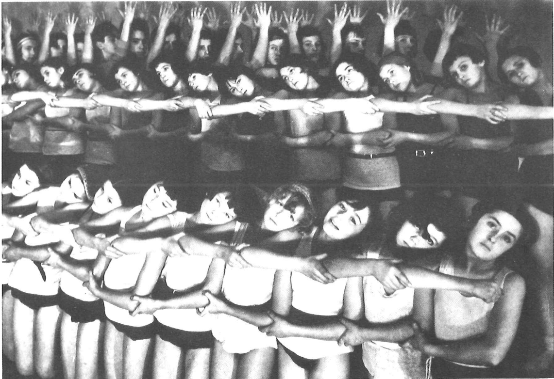
Margaret Bourke-White, Sovjet-danseressen, 1936

Niet de solist, maar de revue. Niet het detail maar de overdaad. Niet die ene, maar die velen in één vormpatroon. Ornament van de massa. En hoe uit de geometrie hulpzoekende blikken priemen.