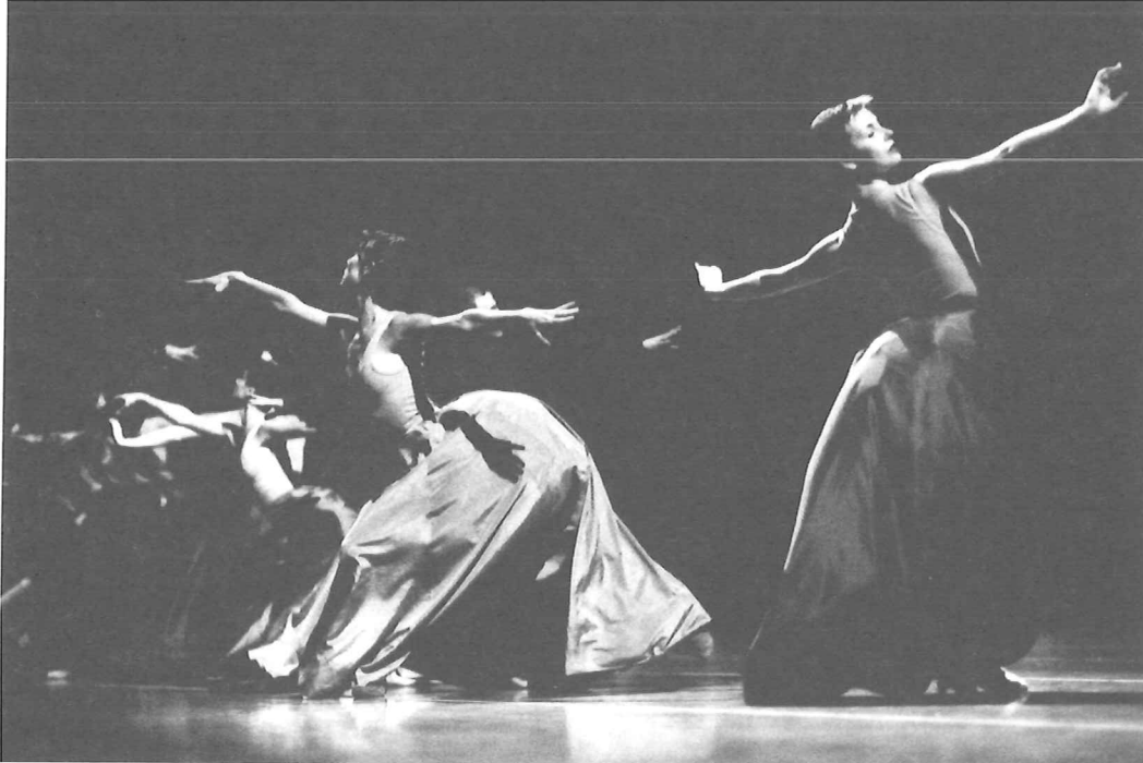
Eidos: Telos - William Forsythe, Ballet Frankfurt