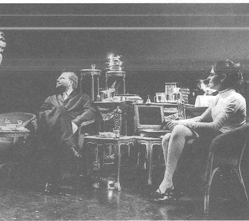
Alles is rustig – Tg Stan / Koen Wessing

Etcetera: Wordt over de ideeën, de zijsprongen van anderen gediscussieerd of ze mogelijk zijn?