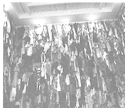
Christian Boltanski, Canada 1988, Vue d'installation , Ydessa Hendeles Art Foundation, Toronto, 1988

Bonita , merk van bananen afkomstig van Ecuador, bananendoos Premium Bananas, recycleable/corrugated 22-XU-PE-W-4, keep bananas at 58°F or 14°C, hier vooral bekend als de ideale verhuisdoos of voor op sjacherbeursen en rommelmarkten (zie hiernaast)