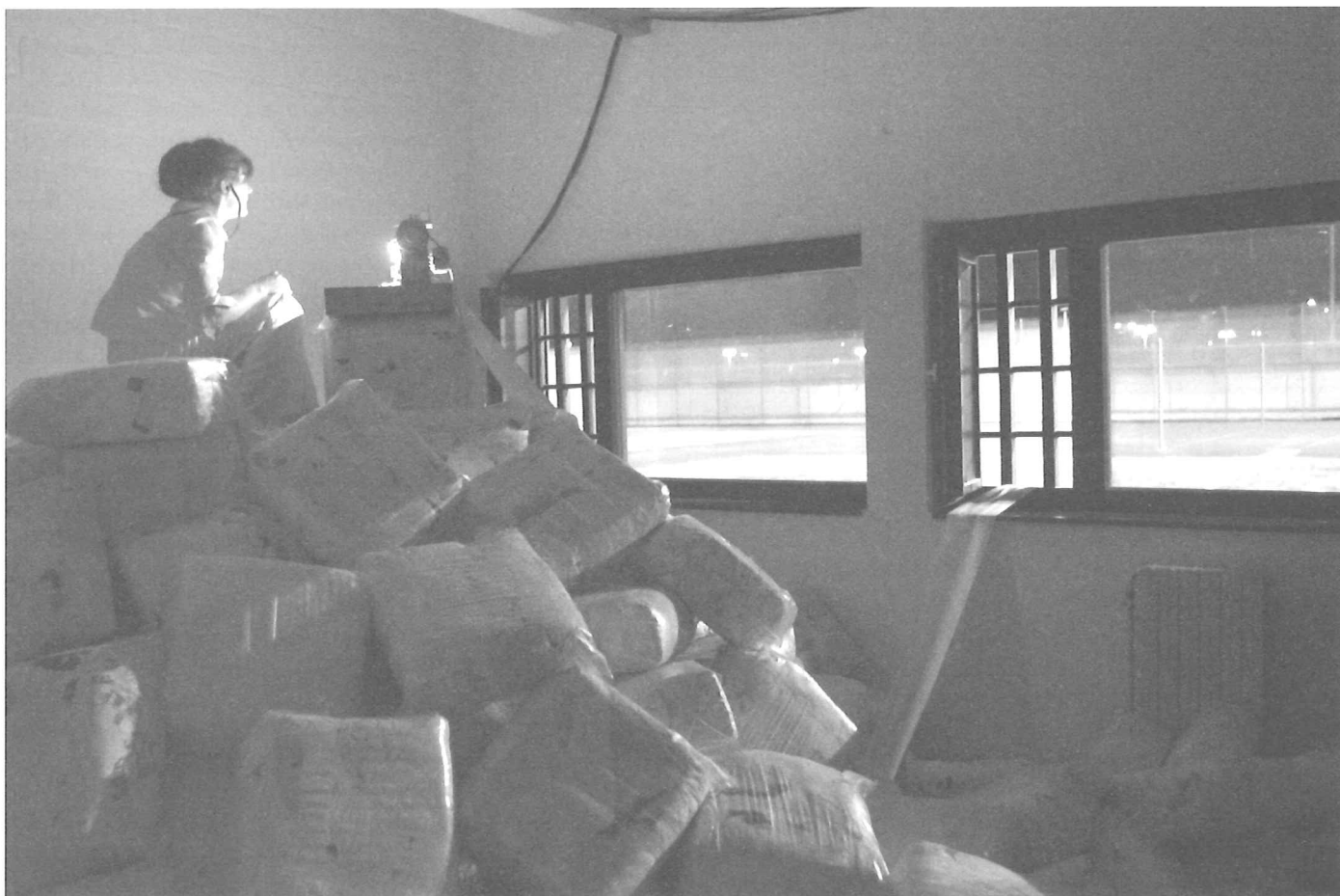
Dogtroep in de Brugse gevangenis DOGTROEP EN BRUGGE 2002

Je komt binnen in de eerste kamer. De blinde vrouw die het karretje bediende, zit in een hoekje. Gekraak van een schommelstoel, een kat die ronkt, de telefoon die gaat – dage-