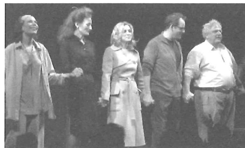
Up for Grabs LAURENCE BOSWELL / SONIA FRIEDMAN PRODUCTIONS EN THEATRE ROYAL BATH PRODUCTIONS