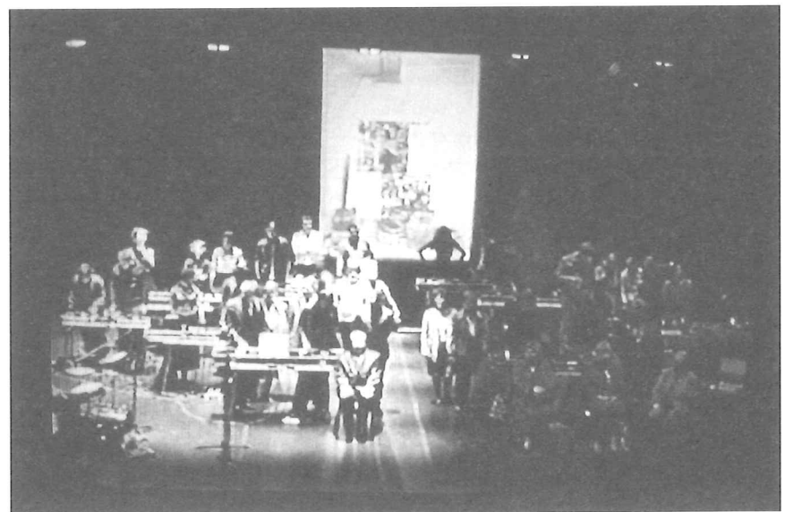
Performance in cc Strombeek-Bever MAARTEN VANDEN ABEELE (APRIL 2001)