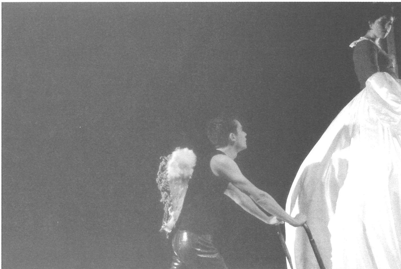
Drift MUZIEKTHEATER TRANSPARANT

chaotische wereld waarin de jongeren ronddolen.