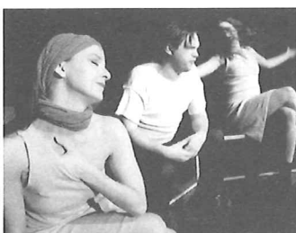
Walk Cat, Walk! TRANSITEATRET