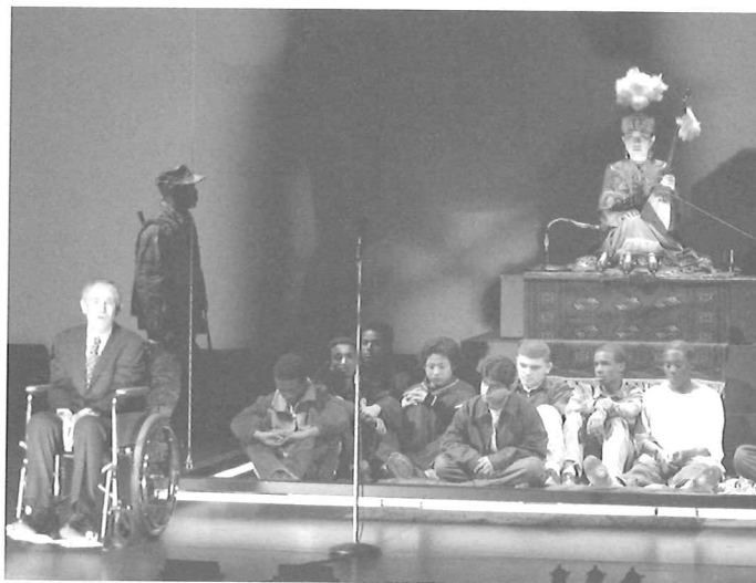
The Children of Herakles PETER SELLARS/RUHRTRIENNALE

lers heeft geraadpleegd omtrent de afloop van een mogelijke oorlog met Argos, blijken de voorspellingen één overeenkomst te hebben: alleen als er een maagd van adellijke geboorte wordt geofferd, maakt Athene een kans een oorlog met Eurystheus te winnen. Het afgedwongen offer van een onschuldig kind: een terugkerend thema bij de tragicus Euripides. En ook hier biedt iemand zich vrijwillig aan: een dochter van Herakles. De oorlog wordt vervolgens in het voordeel van Athene beslist en Eurystheus wordt als krijgsgevangene meegevoerd. Alkmene, de moeder van Herakles en de grootmoeder van de asielzoekende kinderen, wil hem doden. De Atheners maken tegen deze bloedwraak bezwaar. Eurystheus zelf berust in zijn lot: hij voorspelt dat hij vanuit zijn graf een lange oorlog tussen Athene en Sparta zal aanvuren. Euripides' stuk werd geschreven kort na het begin van de Peloponnesische Oorlog tussen Athene en Sparta, die duurde van 431 tot 404