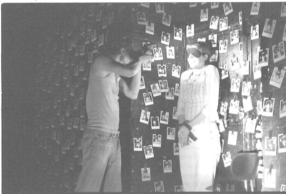
The Smile off your Face ONTROEREND GOED

Halverwege de voorstelling wordt de blinddoek even afgenomen. De in-gebeelde wereld van de toeschouwer begint langzaam uit elkaar te vallen. Gaandeweg krijgt hij meer te zien van de ruimte, de acteurs en de andere toeschouwers. Op die manier wordt hij zelf een voyeur die de 'intimiteit' van de andere deelnemers bespiedt. Tegelijkertijd kijkt hij ook naar zichzelf. De situatie is immers herkenbaar, hij heeft ze net zelf beleefd. De opstelling vrijgeven is voor ons essentieel in de voorstelling. Voor Ontroerend Goed is het tonen en expliciteren van de theatrale illusie een basisgegeven om theater te maken. In The Smile off your Face is dat niet anders. De toeschouwer wordt heel duidelijk geconfronteerd met de kleine, elementair ingerichte ruimte en de eenvoudige manipulaties die hem aan het fantaseren brachten. Het einde van The Smile off your Face , met als centraal beeld een wand vol foto's van geblinddoekte toeschouwers, neemt de illusie weg dat de voorstelling rond iets anders draait dan het publiek zelf. De vele uiteenlopende interpretaties en ervaringen die wij tijdens ons traject te horen kregen, bevestigen dat alleen maar. ●