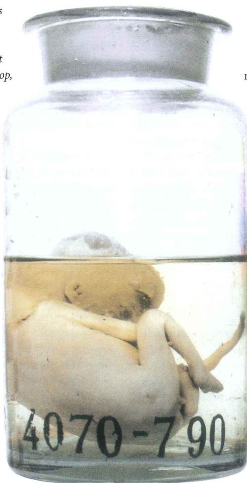
Een foetus in een glazen pot, voor de restauratie in Sint Petersburg, Willem J. Mulder, inspiratiebeeld

Misschien is het de vanzelfsprekendheid, de alledaagsheid van de gestelde handelingen die de pathetiek uit de voorstelling weert. Hier is geen sprake van beeldvorming rond het lichaam zoals afgevuurd in bloederige reportagefoto's, of in de spectaculaire reconstructies van de misdadaanslachten in CSI Miami, waar de camera zich letterlijk in de wonde wringt,