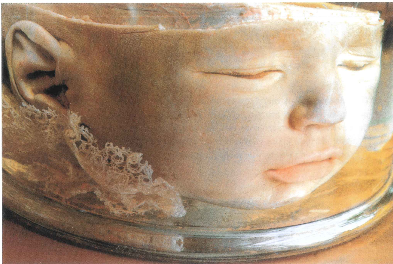
Kinderhoofd uit de collectie van de Kunstkamera in Sint-Petersburg (Rosamond Purcell), inspiratiebeeld

en het geweld met grafisch realisme als een horrorattractie in je gezicht wordt geslingerd. Uit het gehandwerkte kind spreekt een respectvolle afstand. Een langzaamheid in het creatieproces die zich inschrijft in een eeuwenoude verwerkingsstrategie. De breiende of bordurende vrouwen die in hun werk de geschiedenis schreven van families en era's, van herinnering en contextualisering. Een patchwork van verhoudingen en herinneringen, van jaren van heengaan en herdenken, van koestering en transgenerationale erkenning. Maar evengoed bijt het gebruik van precies deze techniek zich uiteraard ook een weg uit de veilige binnenshuizige geborgenheid. Omdat het vertelde verhaal haaks staat op het sociale weefsel dat in het traditionele begrip van het handwerken vervat zit. Borduren, breien, naaien zijn bij uitstek sociaal geconnoteerde activiteiten. Vaak gebeurt het in groep of in de boezem van het gezin. Doorgaans is het een manier om de samenhang letterlijk warm te houden. De gequilde dekens, gepatchworkte muurkleden spreken van een collectieve geschiedenis. Al handwerkend houdt de vrouw (of de occasionele man) de familiebanden en het sociale weefsel in stand, naait het in elkaar, weeft het tot samenhang.