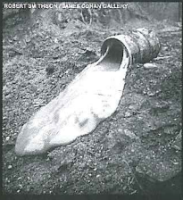
Robert Smithson, Glue Poor , 1969

de jaren zeventig maar wel altijd op haar tijd vooruit. Missien eb je gelijk. Missien is et gewoon mijn persoonlijke ommezwaai van grafieken naar vloeistoffen. et is mogelijk om beide manieren te vermengen: vloeistof-